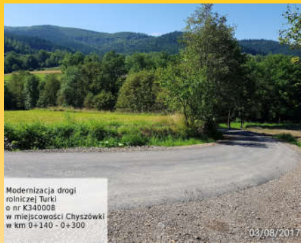
Modernizacja drogi rolniczej Turki o nr K340008 w miejscowości Chyszówki w km 0+140 - 0+300