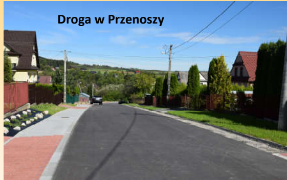
Droga w Przenoszy