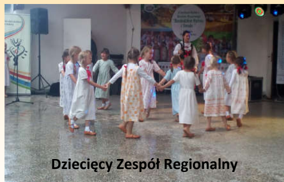
Dziecięcy Zespół Regionalny