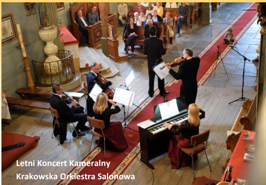
Letni Koncert Kameralny Krakowska Orkiestra Salonowa