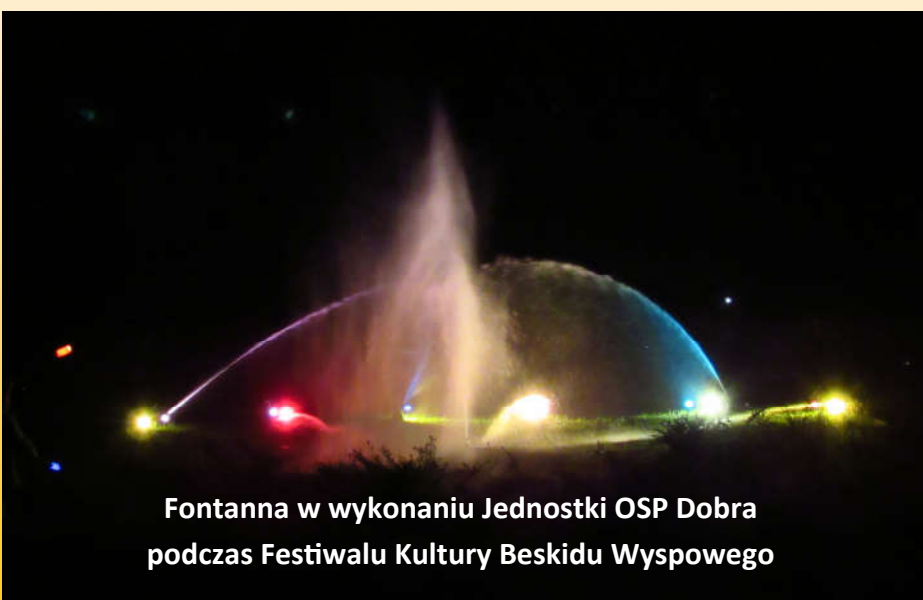
Fontanna w wykonaniu Jednostki OSP Dobra podczas Festiwalu Kultury Beskidu Wyspowego