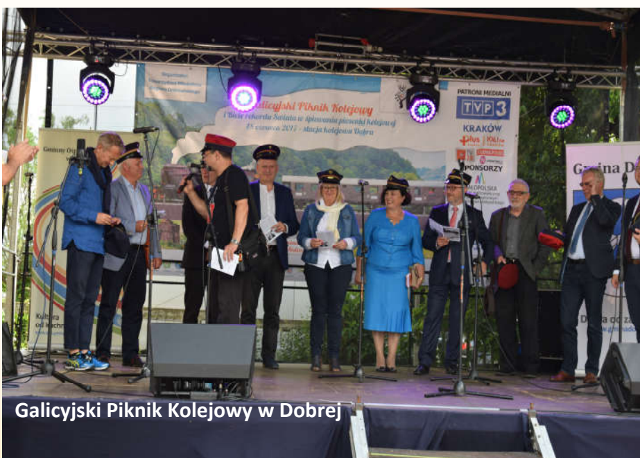
Galicyski Piknik Kolejowy w Dobrej