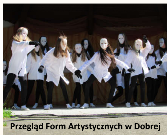
Przegląd Form Artystycznych w Dobrej