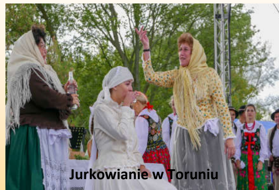
Jurkowanie w Toruniu