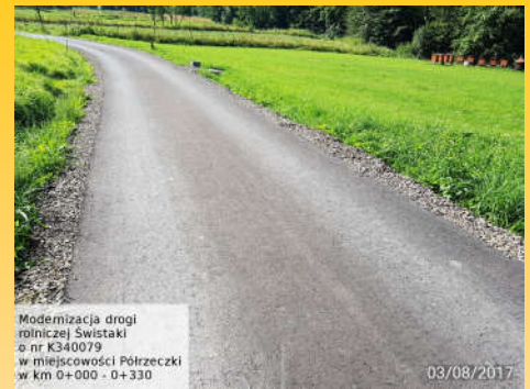
Modernizacja drogi rolniczej Swistaki o nr K340079 w miejscowości Pótrzczy w km 0+000 - 0+330