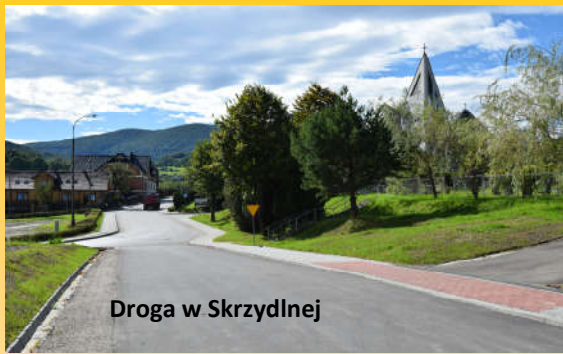
Droga w Skrzydziej