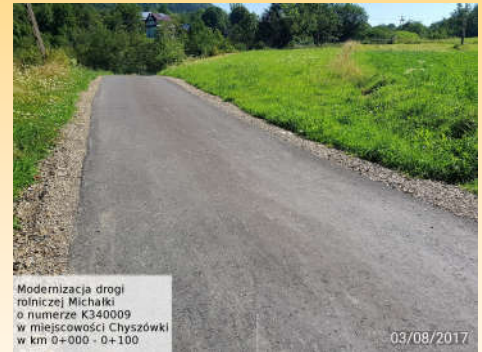
Modernizacja drogi rolniczej Michałki o numerze K340009 w miejscowości Chyszówki w km 0+000 - 0+100