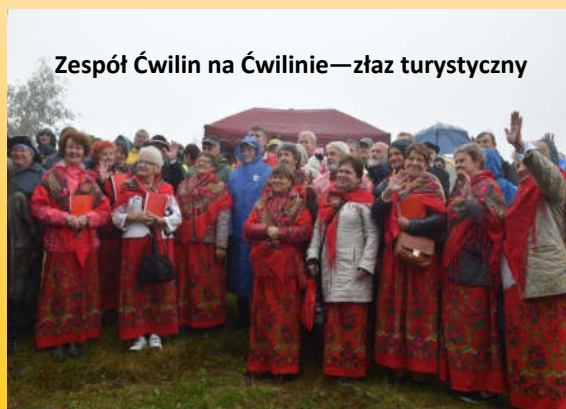
Zespół Ćwilin na Ćwilinie—złaz turystyczny